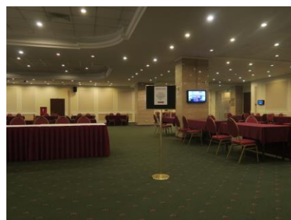
商談会場イメージ