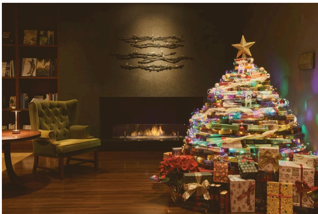
写真：ブックバトンプロジェクトで制作されたブックツリー（2024 年）

ご寄付は郵送でも受け付けております。ご自宅に眠っている本がありましたら、どうぞよろしくお願いいたします。