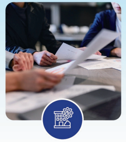
受け入れ環境の整備