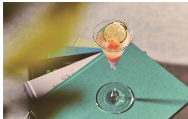
おすすめの期間限定カクテル「Sally ～サリー～」1,400円(税込・サ別)