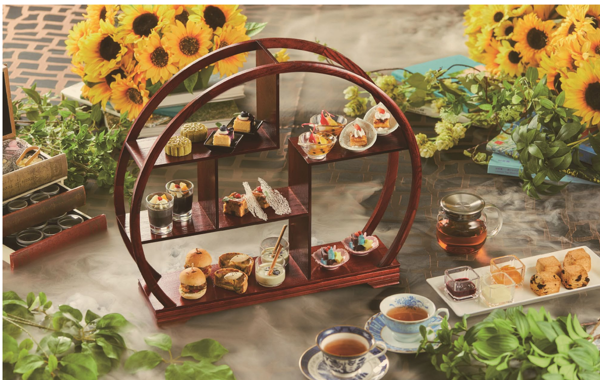
「至福のアフタヌーンティー」 5,500円（税込） 写真は2名分

芝パークホテルのレストラン「ザ ダイニング」では、2025年5月26日（月）から9月7日（日）まで、「至福のアフタヌーンティー」を開催いたします。爽やかな季節にぴったりの特別なメニューでは、ココナッツプランマンジェや抹茶月餅など、涼やかで風味豊かなスイーツが並びます。ミニハンバーガーやアスパラガスのキッシュなど、彩り豊かなセイボリーも充実。16種類のドリンクは自由におかわり可能で、茶葉の交換も楽しめます。さらに、ホテル館内には約1,500冊の本が揃い、午後のひとときを優雅に過ごすことができます。この夏、味覚と心を満たす贅沢なアフタヌーンティーをぜひご堪能ください。