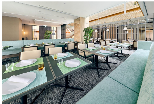
ザ ダイニング 内観