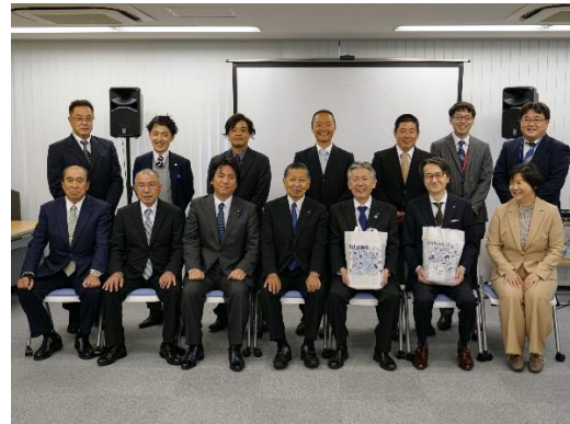
意見交換後の記念写真

5月20日に「第32回新島トライアスロン大会」、5月29日～6月1日には「新島プロ」サーフィン大会開を催予定で盛り上がりを見せています。白い砂浜が7km続く新島の代名詞「羽伏浦海岸」、式根島を代表する鉤で割ったような地形で絶景の「地鉤温泉」など。その他にも、1村2島ならではの多様で魅力的な観光スポットが点在しています。