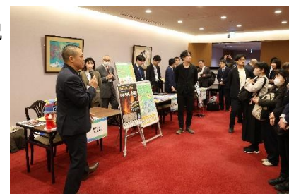
【第3部】観光事業者交流会

また、第3部の観光事業者交流会では、16の事業者ブースを出展いただきました。講師のお二人にもご参加いただき、リアルな場で、活発な交流が行われました。