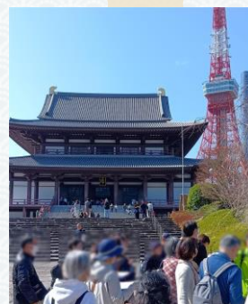
▲まち歩きツアーの様子