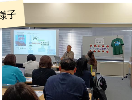
式根島エリアマネジメント様によるご講演の様子