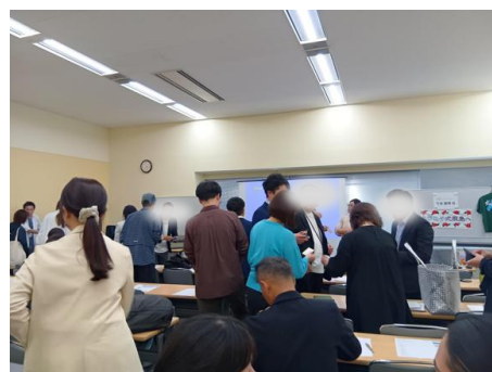
ミーティング終了後の様子