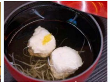
地場産物を活用した 特産品開発