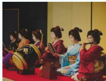
体験プログラムの造成