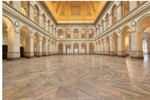
【レセプション会場】