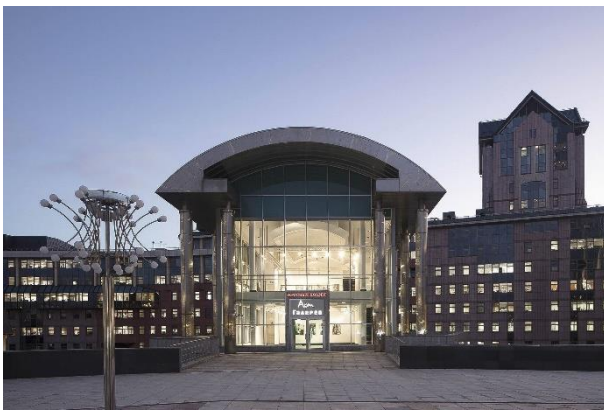
会場エントランス