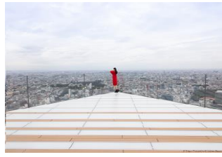
渋谷スクランブルスクエア