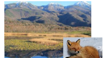
<知床連山と知床五湖>

全5地域（知床、白神山地、小笠原、屋久島、奄美・沖縄） の観光関連事業者、都内旅行会社等、関係自治体 等