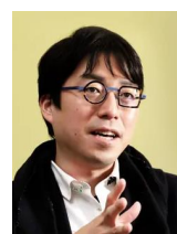
成田 悠輔 氏