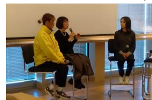
【パネルディスカッション(対談)】

◆ アーカイブ配信と海外調査報告を公開していますので、ご関心のある方は是非ご覧ください！