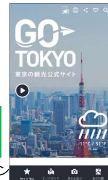
GO TOKYO スマートフォンサイト

東京観光の魅力やPRできる内容の施設やイベント紹介、サービス紹介を、当財団公式X (旧 Twitter) アカウントから発信・リポストのサポートをいたします。