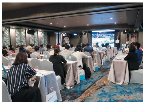
海外での共同観光セミナー開催

海外の旅行博や観光・ビジネスイベントプロモーションに、当財団と共同で参画いただけます。また、資料配布のみの参画も可能です。