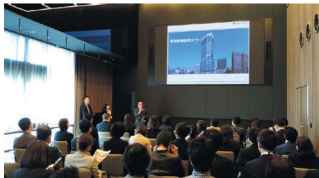
東急歌舞伎町タワー