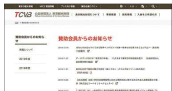
賛助会員からのお知らせ

コーポレートサイトのトップページにバナーリンクを設置できるほか、賛助会員のプレスリリースやイベント情報等を掲載できるページもあります。また、そこに掲載された情報は週に一度賛助会員に向けて配信する TCVB メール速報 P5 参照 にも掲載されます。